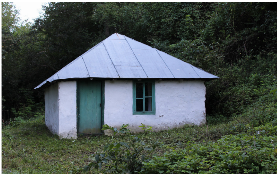
Turbe u Sjeverinu