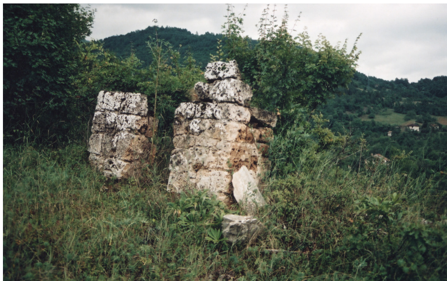
Ostaci turbeta roditelja Mehmed-paše Sokolovića