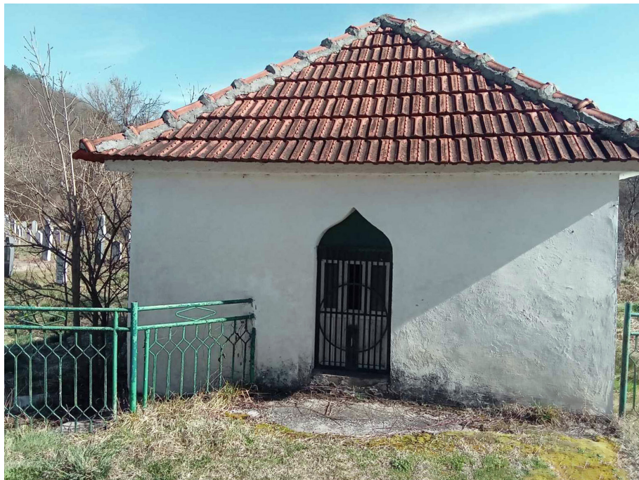
Turbeta nepoznatog šehida u Starom Rudom