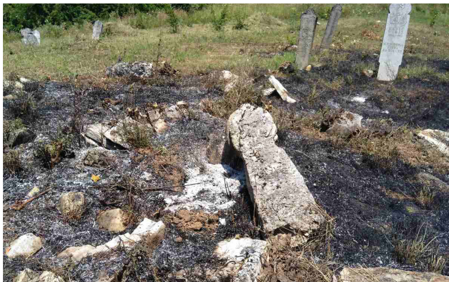
Lokacija turbeta u Ustibru - mezarje Dragošuma