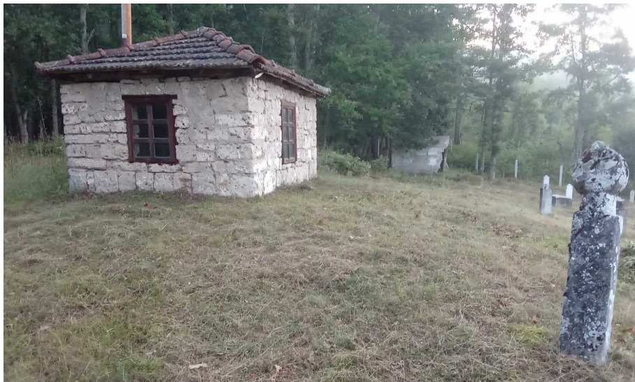
Turbe u Obrveni

Keywords: Rudo and its surroundings, mosque, tekke, waqf, turbe (mausoleum), turbedar (mausoleum keeper).