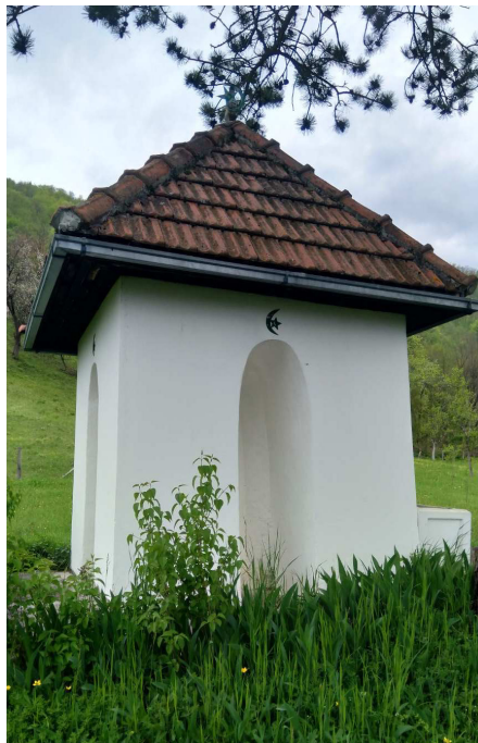
Obnovljeno turbe u Mioču