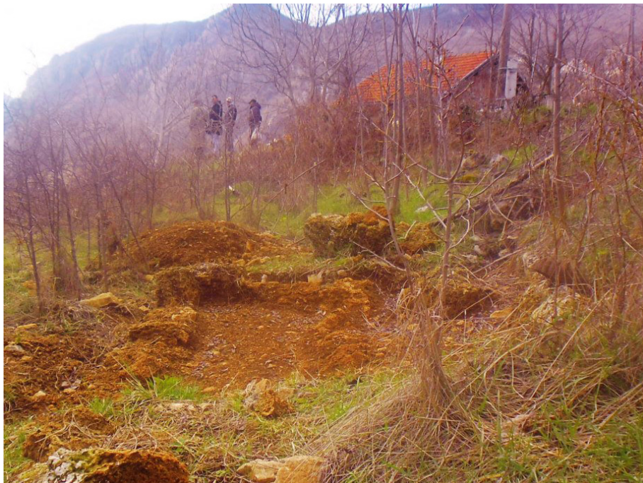
Mjesto i ostaci turbeta šejha Piri-bega u Donjoj Strmici