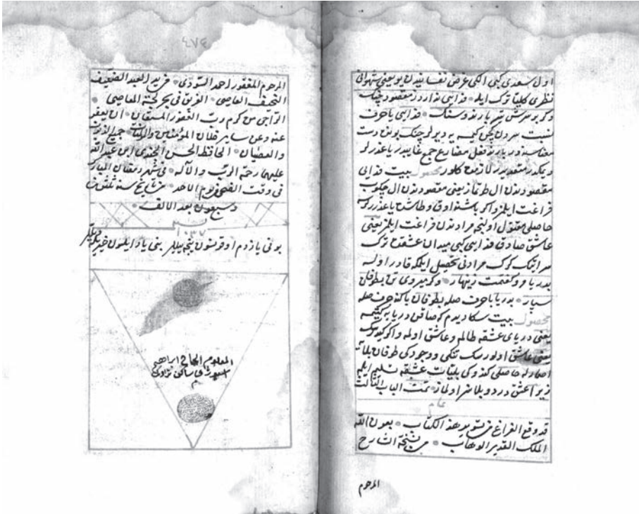
Kraj Sudijevog komentara Bustana, prepisan iz autografa 1037/1628. godine, u kojem je prepisivač naveo pravo ime autora (GHB, R-1630, fol. 473a).