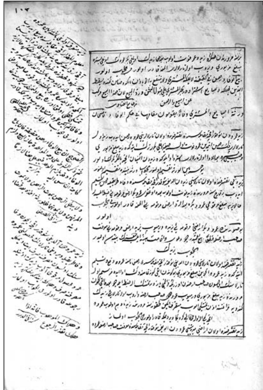
Dvije fetve livanjskog muftije Abdullaha iz oblasti agrarnih odnosa na marginama djela Fatawā-i Aḥmadiyya ma'a Qānūniyya mostarskog muftije Ahmeda.

Objašnjenje: Autor djela Al-Manzūma fī al-fatāwā navodi da zalogopri- malac nema pravo vlasništva niti pravo korištenja zaloga bez dozvole zalo- godavca.