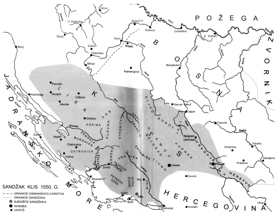
Ova karta Kliškog sandžaka preuzeta je iz Opširnog popisa Kliškog sandžaka iz 1550. godine , a izradio ju je Aladin Husić.

godine još uvijek se dosta često sreću novi muslimani sa nemuslimanskim imenom oca, dok se već u sljedećem iz 1585. godine novi muslimani najčešće navode sa eufemizmom Abdullah kao imenom oca. 50 To je donekle i logično, jer se u povećanom broju muslimana kod neofita povećava i želja, a možda i potreba, za utapanjem u većinsku masu. Takva se situacija zatiče i u drugim krajevima, ne samo u srednjodalmatinskom zaleđu.