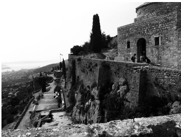
Pogled na različite nivoe Kliške tvrđave: na najvišem se vidi zgrada Džamije Murad-bega Tardića, sada Crkva sv. Vida. U pozadini se vidi Split, udaljen desetak kilometara od tvrđave.

teritoriju novoosnovanog sandžaka u početku su djelovala samo dva kadiluka – Kadiluk Skradin i Kadiluk Neretva. Širenjem teritorija i organizacijom i reorganizacijom i sudske i upravne vlasti, u toku XVI stoljeća osnivani su novi kadiluci. Godine 1580. izvršena je upravna reorganizacija, te je osnovan i Sandžak Krka ili Lika. 9