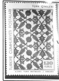
Stylized Flowers 16th century

On the 60k, the black ink was applied by a thermographic process and varnished, producing a shiny, raised effect to imitate the embossed tiles of the design source.