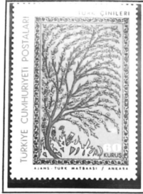
Hürem Sultan Mausoleum, Istanbul