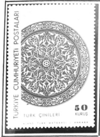
Green Mausoleum Bursa